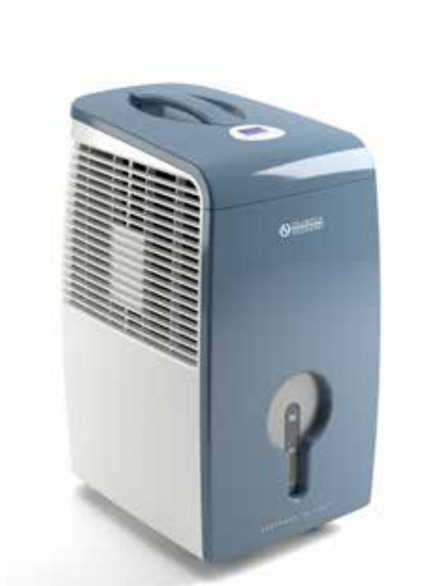
Design by King & Miranda